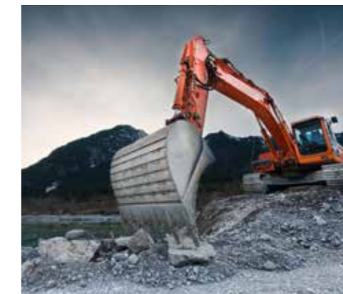
A.C.E. / A.C.E.

To meet the need of diverse industrial sectors, high performance paints designed to resist high and low temperatures, weathering and corrosion.