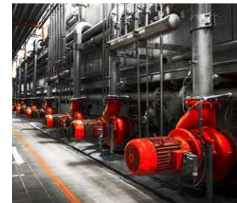
INDUSTRIA GENERALE / General industry

These paints protect commercial and transportation vehicles from the wear caused by environmental factors.