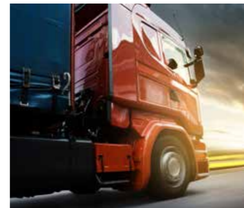
VEICOLI COMMERCIALI E DA TRASPORTO / Commercial and transportation vehicles

ICROTECH is ICRO's industrial brand, designed with a clear mission in mind: "ACTION". This concept translates into a suite of top quality services and products to protect refinish and decorate. These high performance products are guaranteed by the quality system certification to the standard of ISO 9001-2008. The ICROTECH product range boasts efficient solutions in solvent technology (solvent borne) and VOC solvents available in a systemic version, for broad-spectrum applications, and in a "made to measure" version which can be altered to meet particular customer requirements. A mix of features that satisfies our clients in terms of quality, quantity, performance and cost. As well as industrial products and colours, ICROTECH also offers training and technical support through our team of experts.