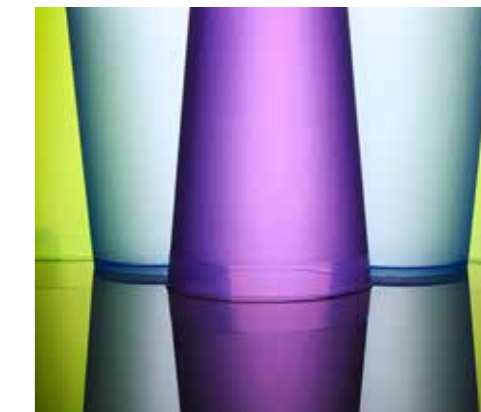
FINITURE SPECIALI / Specialities

These paints guarantee excellent resistance to corrosion for machines used in agriculture, construction sites and to move earth.