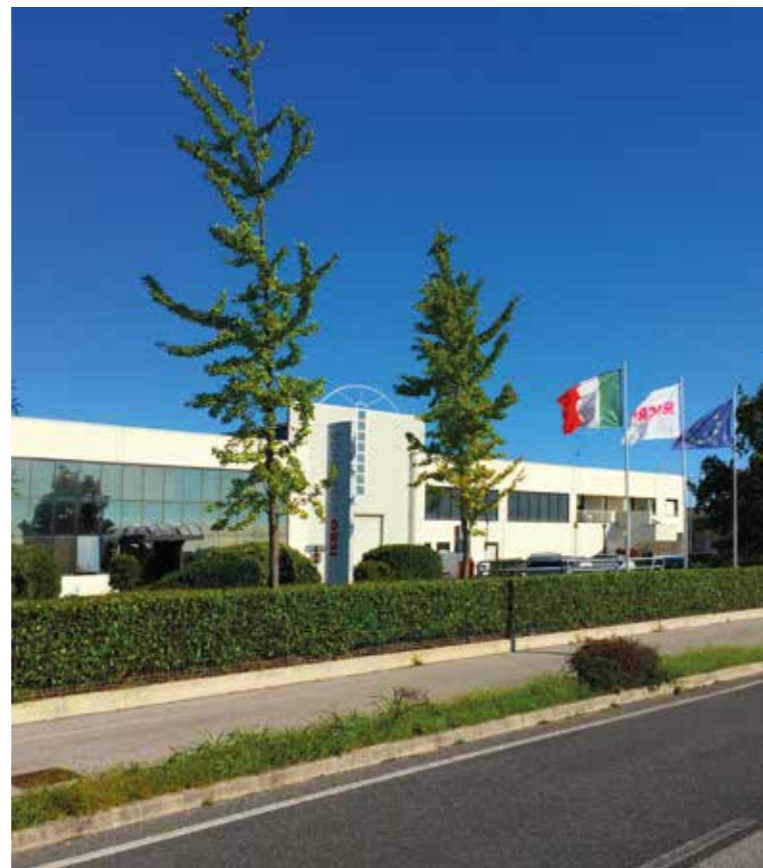
Cinto Caomaggiore (VE) - Italy