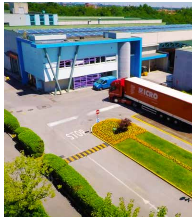
Chignolo d'Isola (BG) - Italy headquarters